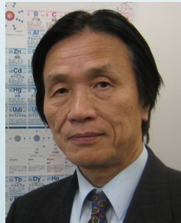
ネオジウム磁石の発明者 1968年電気工学専攻修了 佐川真人博士 2012年日本国際賞、 2022年度エリザベス女王 工学賞受賞

著名な卒業生を多数輩出。日本のものづくりを牽引し、社会の中心となってめざましい活躍されています。機関誌、「先輩万歳」に連載しています。