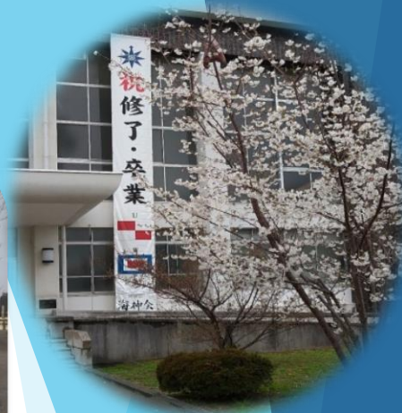
深江キャンパス部活動