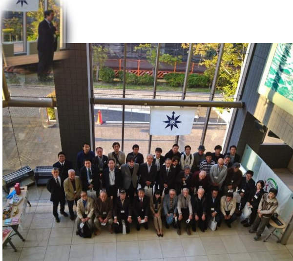
2022年ホームカミングデイ集合写真

会誌「海神会だより」は毎年3月に発行しています。 尚、暦年の会誌は海神会HPより閲覧できます。