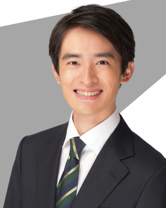
高島 峻輔 市長